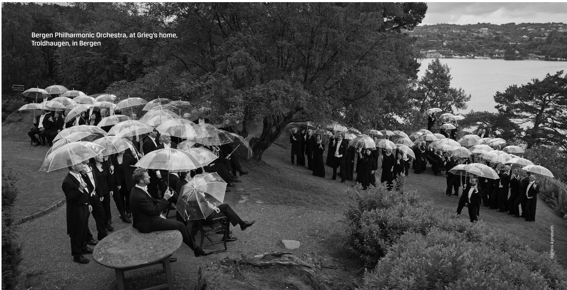
Bergen Philharmonic Orchestra, at Grieg's home, Troldhaugen, in Bergen