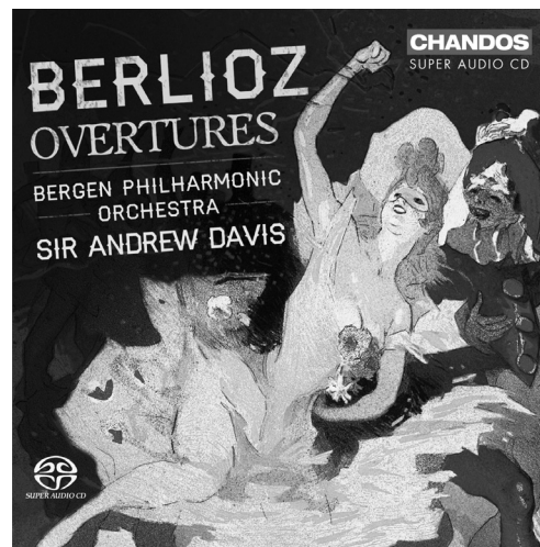
Berlioz Overtures CHSA 5118

Also available from the Bergen Philharmonic Orchestra