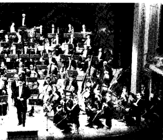
monie de Lorraine