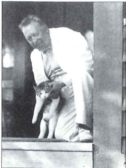
Wilhelm Peterson-Berger and his cat Kurre.

The second album of Frösöblomster has however not even nearly achieved the popularity of the first. This is to a great degree undeserved — but perhaps explicable. Peterson-Berger seems to have been himself to an even greater extent, more uncompromising and considerably less public-oriented. The colours are darker and the writing for