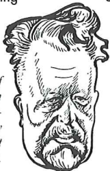
Portrait of Wilhelm Peterson- Berger by Albert Engström.