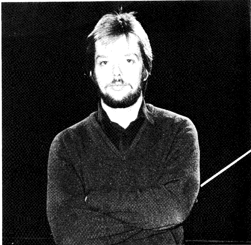
Jukka-Pekka Saraste