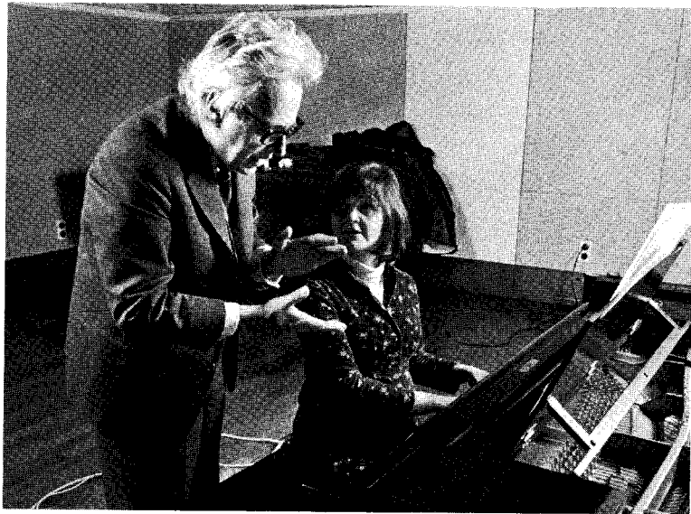
György Ligeti & Liisa Pohjola

ALL THE INTERPRETATIONS ON THIS CD HAVE BEEN SUPERVISED BY THE COMPOSER. THE RECORDINGS HAVE IN EVERY CASE BEEN AUTHORIZED BY THE COMPOSER. THE "DOUBLE CONCERTO" AND "SAN FRANCISCO POLYPHONY" WERE RECORDED AT A LIVE PERFORMANCE.