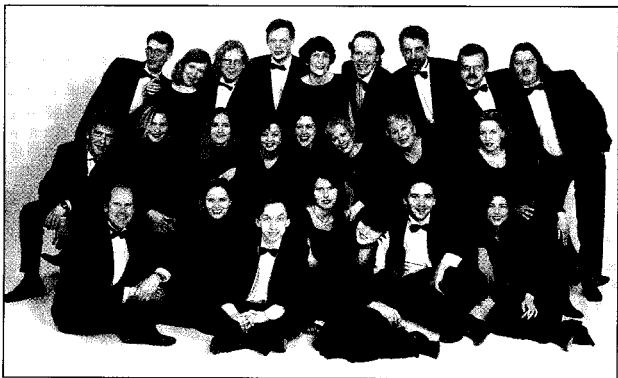
Latvian Radio Choir