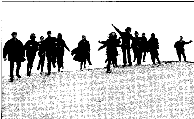
Rīga Chamber Players